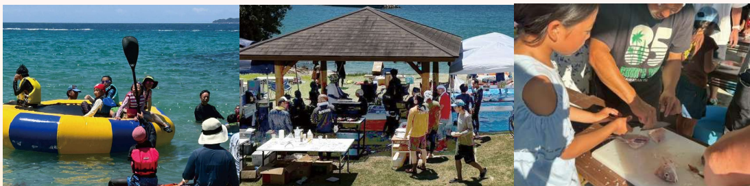
海でのアクティビティ

【8月2日】ラジオ体操からは始まった2日目。mural art、岡山理科大学による科学 の体験事業！お昼からはお楽しみのビーチでの海の交流事業と高島BBQ！夕方は漁 師さんによるお魚教室と交流ちくわカレー作りと盛りだくさん。忘れられない笑顔を たくさん見られました。